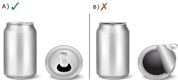
A) Đồ đựng bằng kim loại hội đủ điều kiện có nắp mở ra lỗ nhỏ B) Nắp đầu 360 có thể tháo rời ra thì bị cấm

Các lon kim loại không được phép có nắp có thể gỡ rời hoàn toàn khi mở ra, chẳng hạn như lon có đầu 360 hoặc nắp có vòng kéo/bật lên kiểu cũ mà nắp có thể tháo rời ra. Nắp có thể tháo rời không bao gồm nắp vặn và nắp có khoen kéo bật mở lỗ nhỏ (stay-tab) phổ biến.