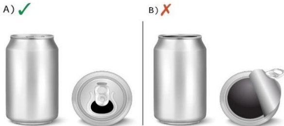
A) 스테이 온 탭이 달린 적격 금속 용기 B) 금지된 분리형(360 도 풀 탭) 뚜껑

개봉 시 완전히 제거되는 뚜껑(분리형 뚜껑)이 달린 금속 캔은 승인이 불가합니다(예: 뚜껑을 분리할 수 있는 360 도 풀 탭(pull tap) 또는 구형 방식의 링 풀(ring-pull)/팝 탭(pop-top) 탭 뚜껑). 그러나 트위스트 탭이나 보편적인 스테이 온 탭은 분리형 뚜껑에 포함되지 않으므로 적격 용기에 속합니다.